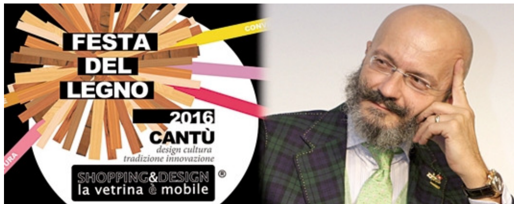
Oscar Giannino, ospite di Confartigianato Cantù in occasione della Festa del Legno

Meno fisco e più impresa vuol dire più sviluppo. E' questo il titolo del dibattito promosso da Confartigianato Imprese nell'ambito della Festa del Legno, con un prestigioso ospite: Oscar Giannino, che mercoledì 5 ottobre presso il Teatro San Teodoro di Cantù, affronterà insieme agli artigiani della delegazione i vari risvolti di questa importante equazione. Giornalista e conduttore di Radio24, Oscar Giannino è un grande conoscitore della materia economico-finanziaria e sarà affiancato dal Vice Direttore del quotidiano La